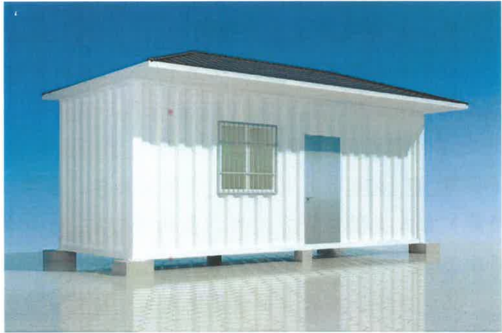
设施农业用地涉及地类面积明细表