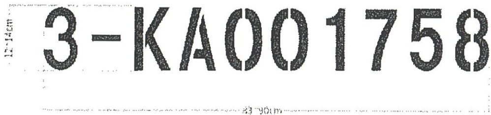
图 9 喷涂字体样式

字体样式： 一般情况，机身喷涂文字采用白色漆进行喷涂。编码中文字高度建议为 12 到 14 厘米，整个编号（含 10 个数字或字母）总宽度为 83 到 90 厘米。