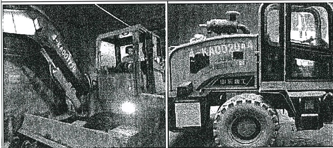
图 3 机身没有位置的，可选机臂、车门、机盖等位置喷涂