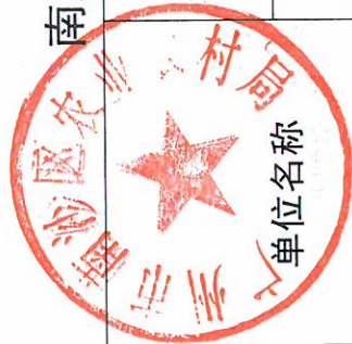
南沙区农业农村局（部门）2019_年度行政处罚实施情况统计表